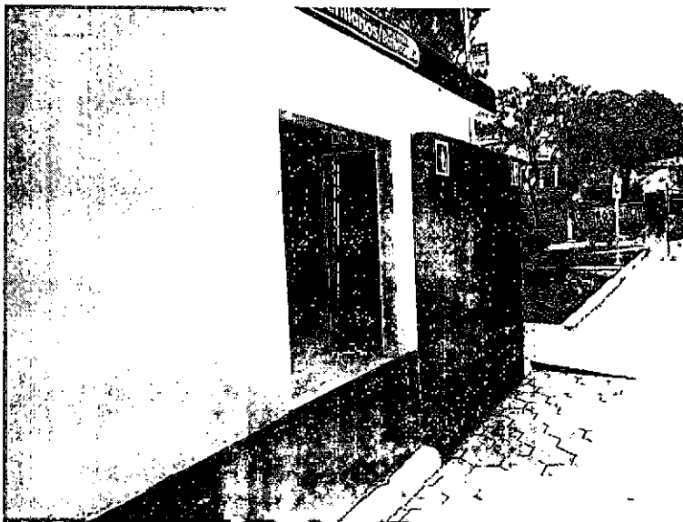
Vista externa da entrada