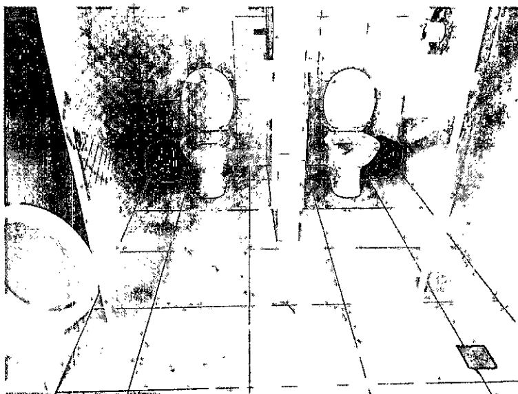
Vista interna do banheiro masculino