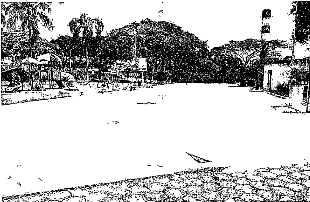
Fotos da área de playground.