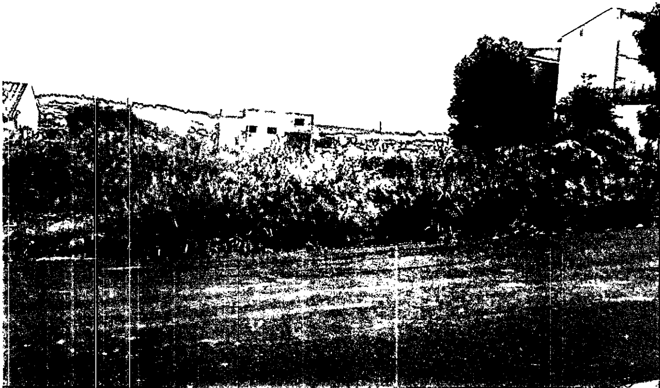
Tipo: Limpeza de Terrano Local: Rua Guerino Furlan, ao lado do nº235, Jardim Maria Rosa