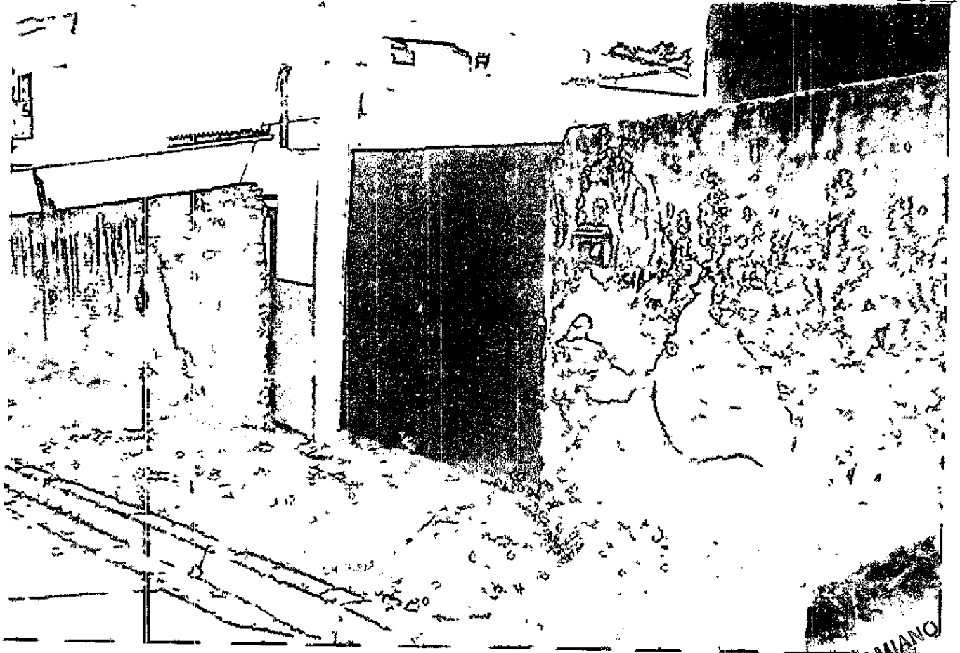
Tipo Pavimentação do Passeio Público Local: Rua Rio de Janeiro, ao lado do nº 21, Vila Santana.