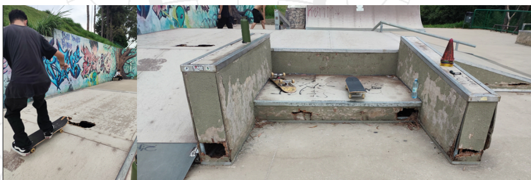
Pontos com buracos na madeira e pontas metálicas danificadas com risco de quedas e lesões.

Outro ponto importante é que no local não existem holofotes (iluminação), impossibilitando o uso da pista a noite e muitas vezes é o único horário que as pessoas tem para fazer uma atividade esportiva, e inclusive não faz sentido uma vez que o recinto do Parque fica aberto até às 22:00 hs.