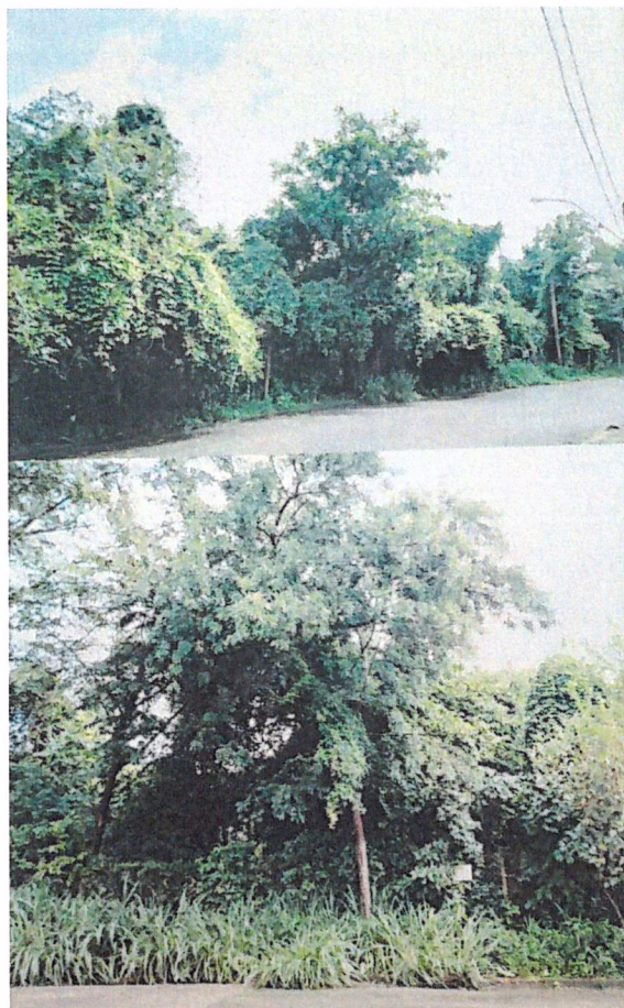
Figura 02: Mata existente em frente ao endereço citado.