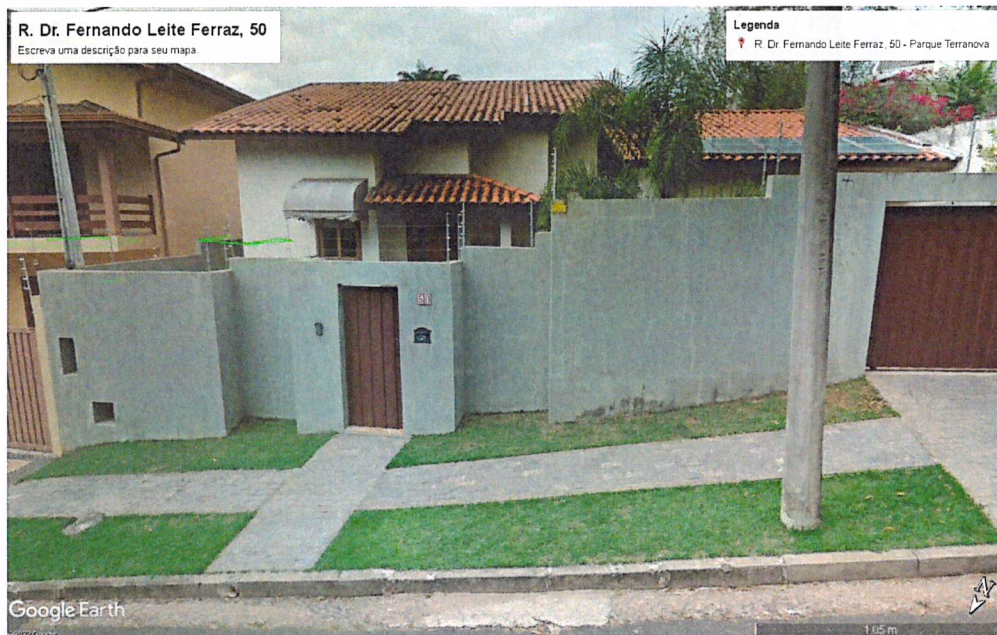
Figura 01: Imagem do Google Earth demonstrando que não há exemplar na calçada citada.

4 - Foi realizada vistoria ao local, porém, constatou-se que na calçada do imóvel em questão não há nenhum exemplar arbóreo. Constatou-se somente a existência de uma mata do outro lado da rua, não havendo no local árvores em estado visual evidente de risco. Solicitamos maiores informações quanto ao exemplar solicitado para que uma nova análise e vistoria possa ser realizada.