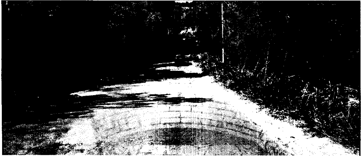
Foto nº 1, travessia de animais silvestres.

C.M.V. _____ Proc. Nº 30401/20 Fls. 02 Resp. _____