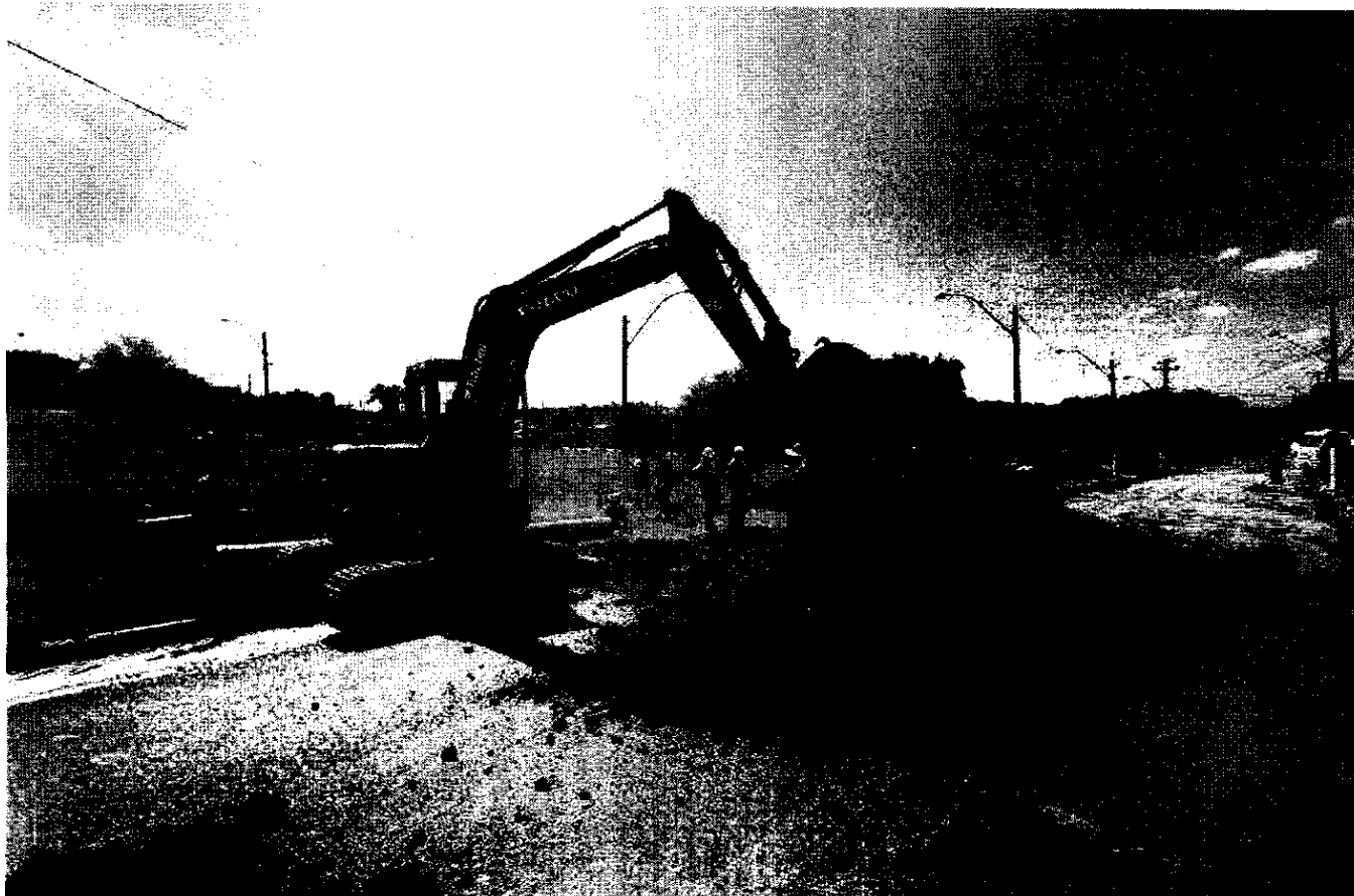
Regiões do Espírito Santo, Parque Portugal, Frutal e Parque das Colinas serão as maiores beneficiadas

07 Outubro 2019 Atualizado em 07 Outubro 2019