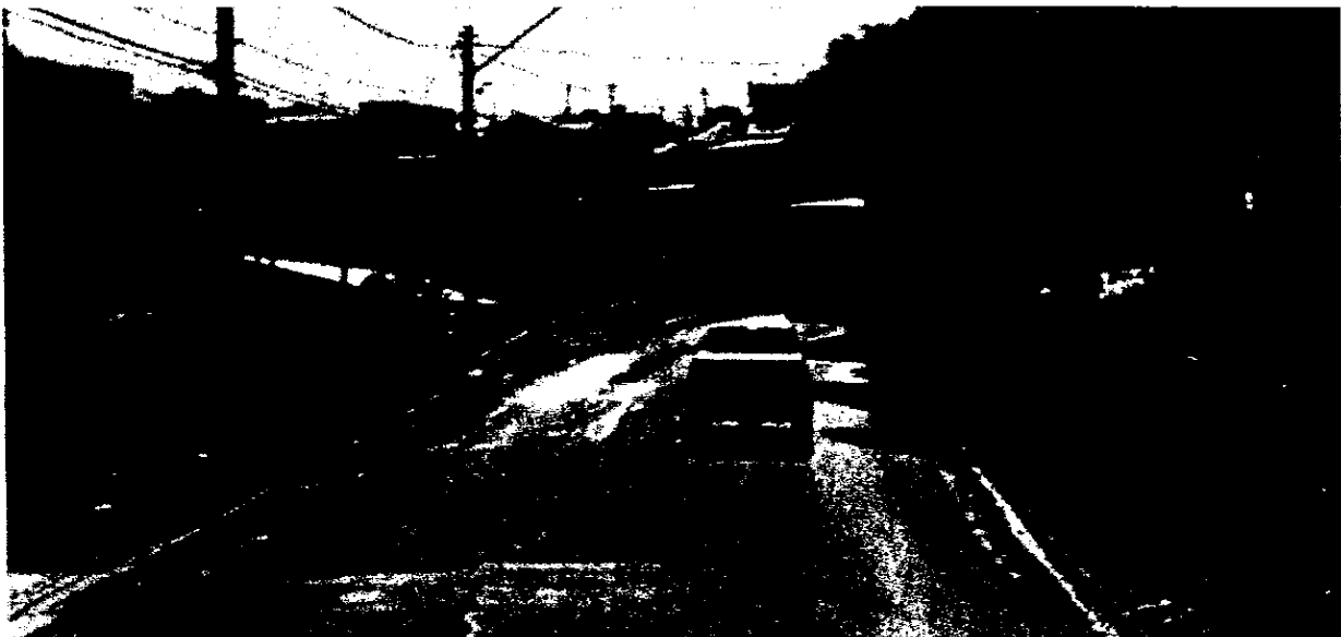
Ponto 13 – Rua João Previtalle, nº 500 (sentido centro-bairro)