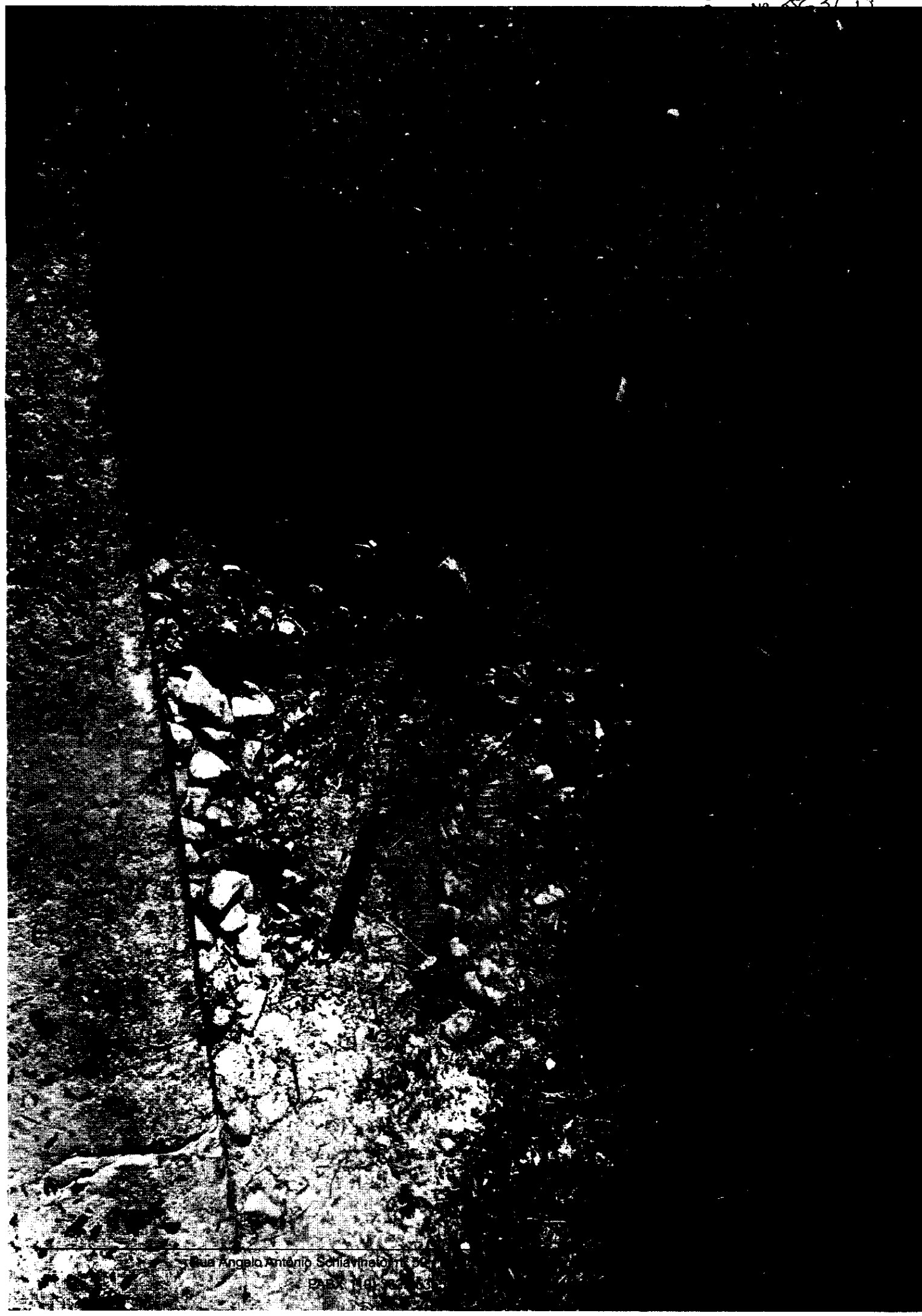
Strada Angela Antonio Schiavoneom, 300 P.A.S. - 101 - 100