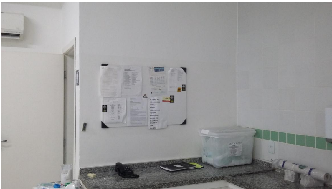
Pintura na sala de emergência denominada “Sala Vermelha” – Térreo