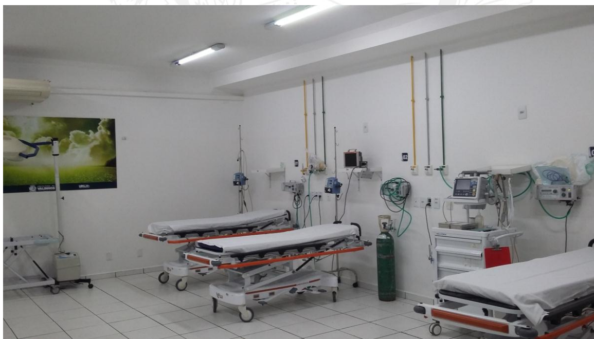
Pintura na sala de emergência denominada “Sala Vermelha” – Térreo