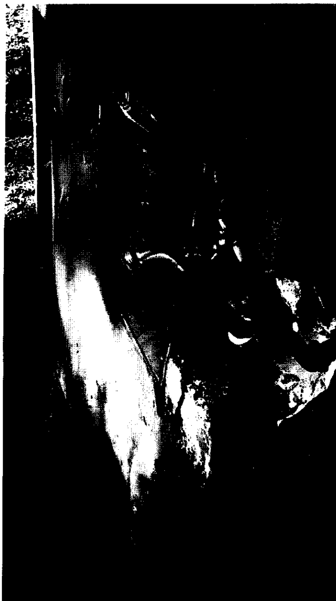
Torneira na Praça Amélia Borin – Jardim Paraíso