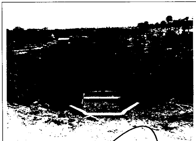
Vista da saída da drenagem para propriedade limdeira, observa-se o dissipador de energia implantado e a ausência de erosões.