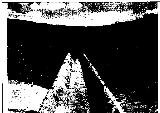
Detalhe da drenagem implantada no interior da bacia de detenção.