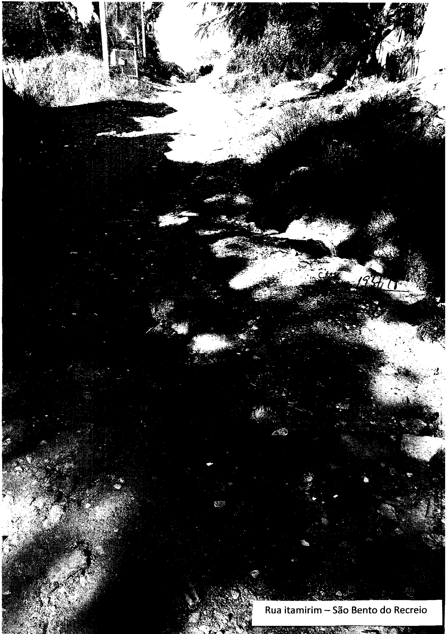
Rua itamirim – São Bento do Recrio