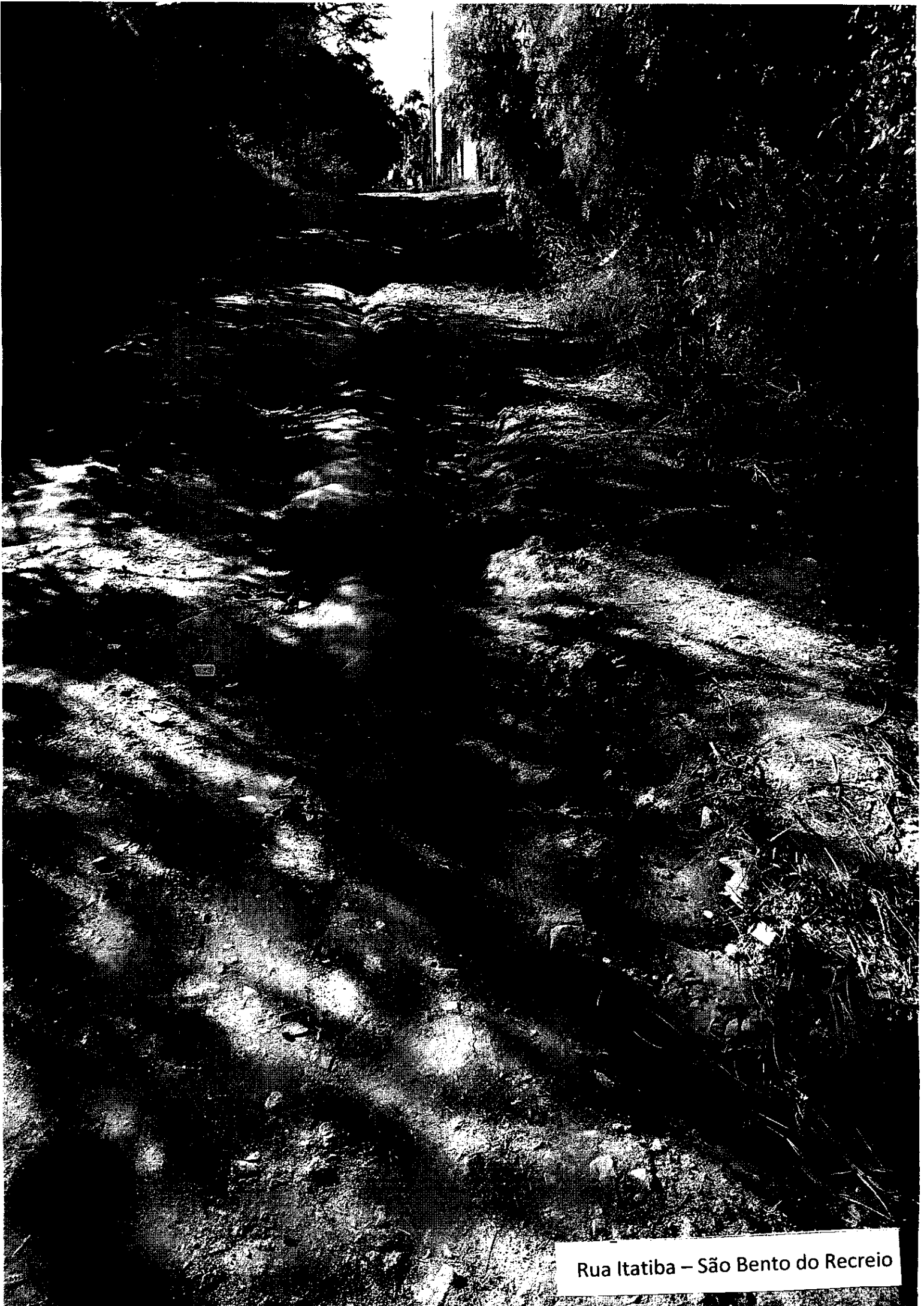
Rua Itatiba – São Bento do Recreio