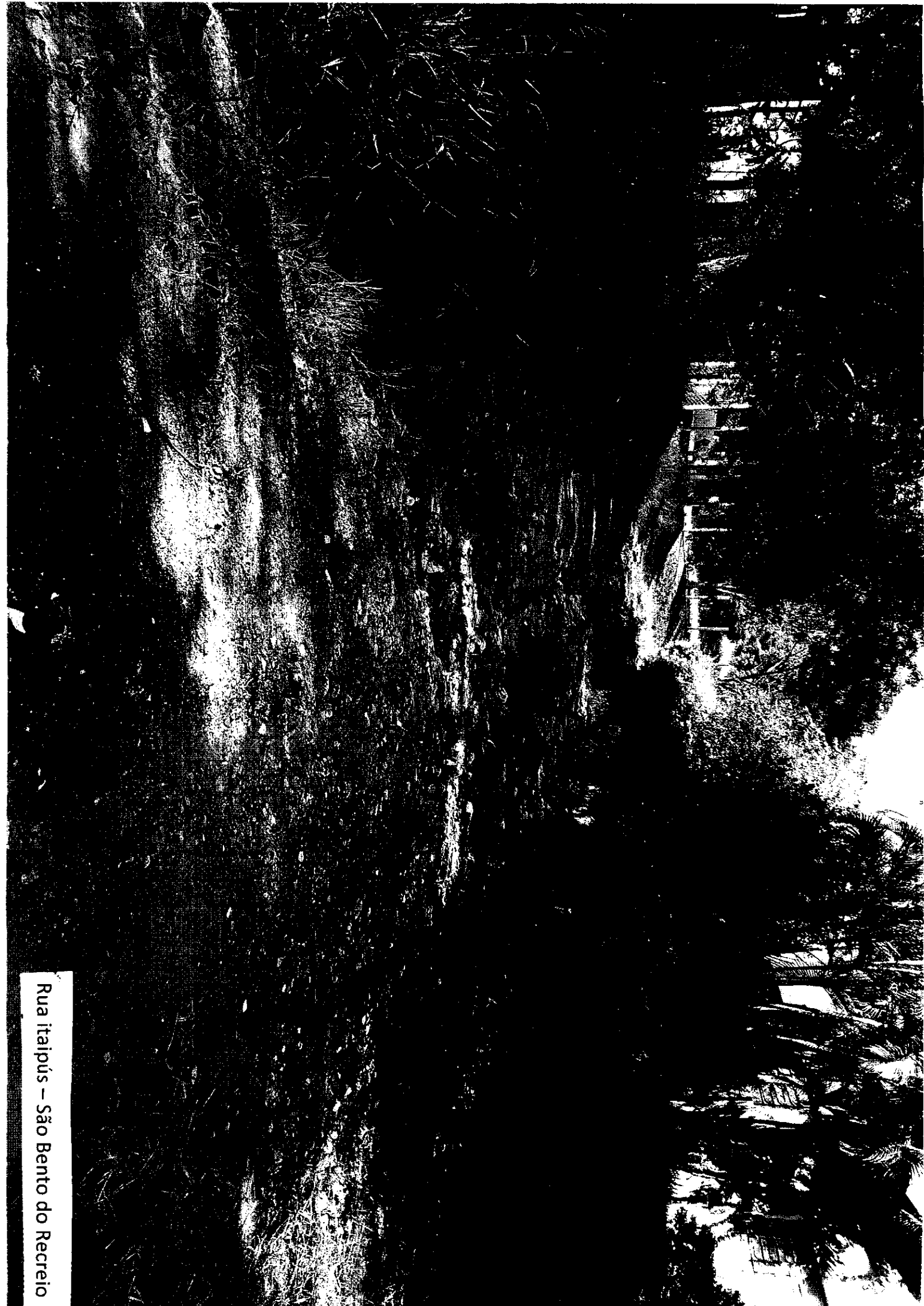
Rua itaipús – São Bento do Recreio