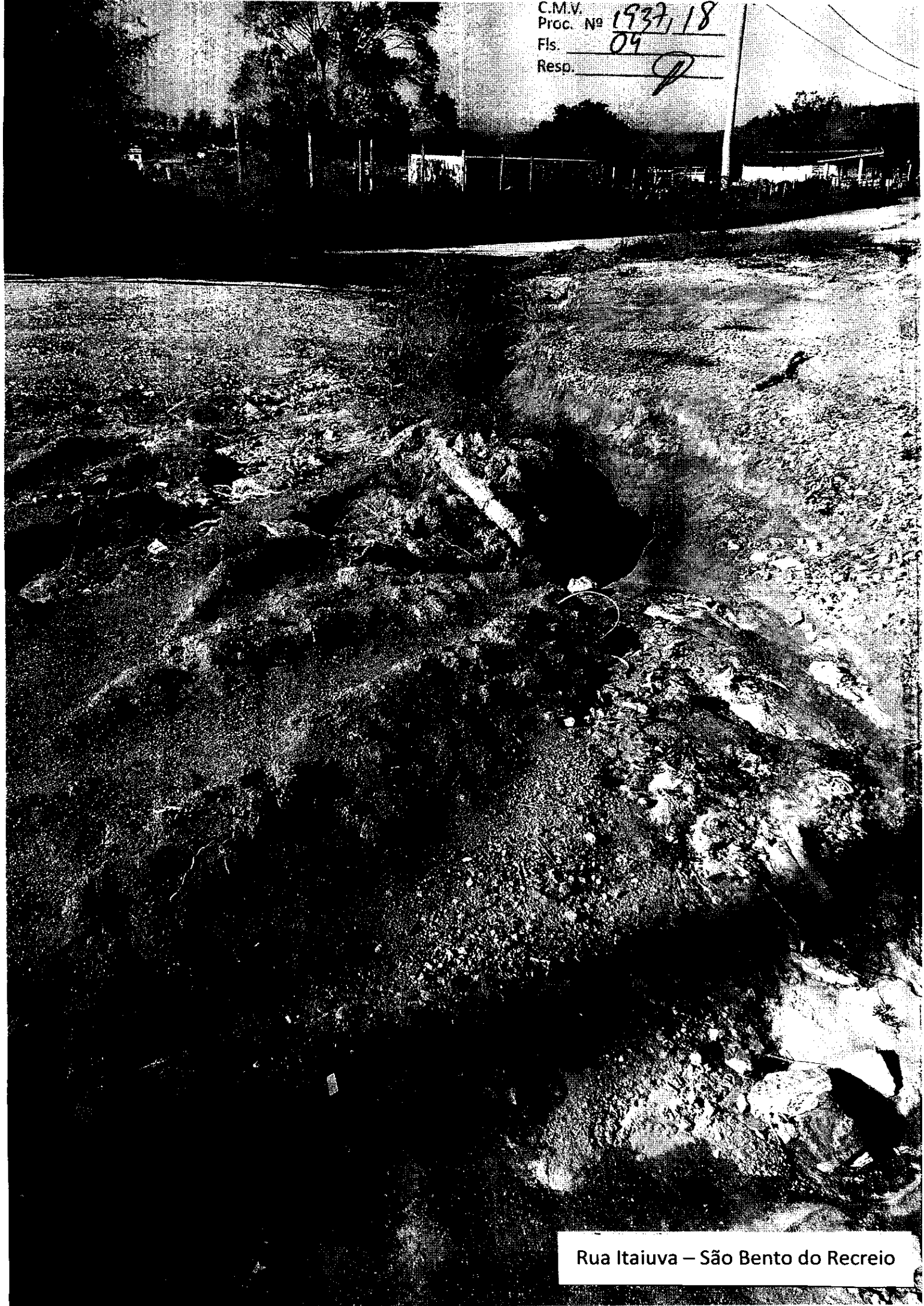
Rua Itaiuva – São Bento do Recrio

C.M.V. 1937, 18 Proc. Nº Fls. 04 Resp. P