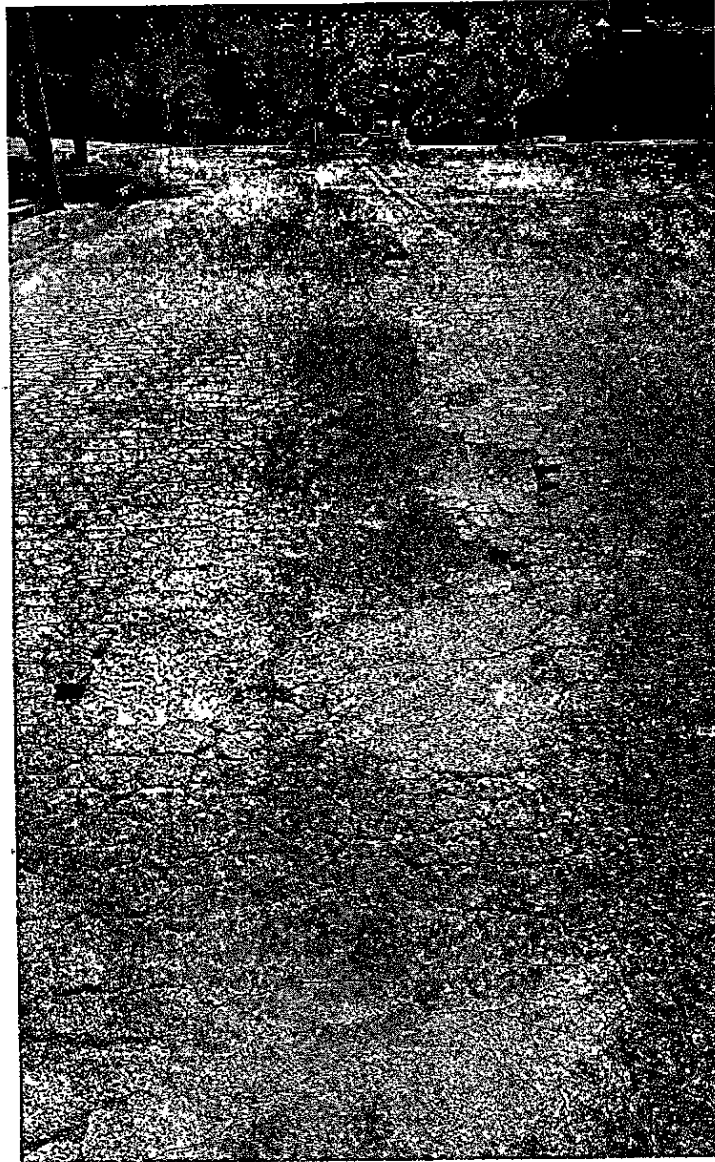
Defronte nº 231 Rua Antônio Peixoto