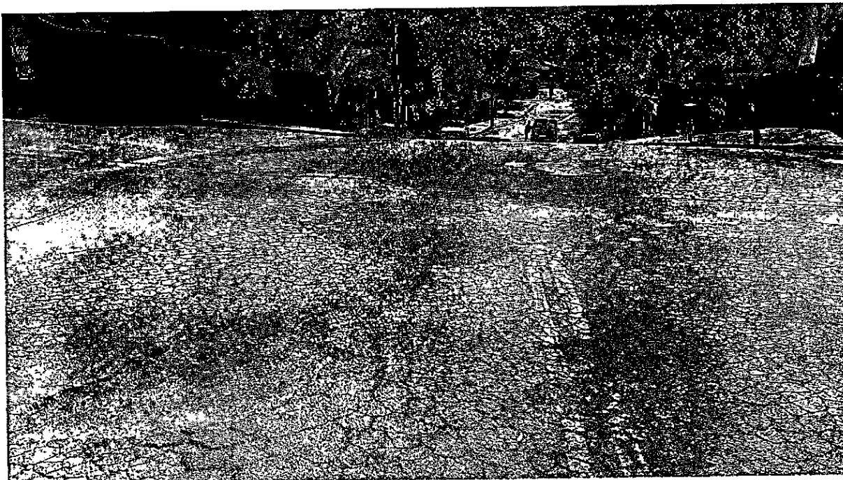
Cruzamento entre as Ruas Antônio Peixoto e Luiza Aparecida Dallanegra Bracalente