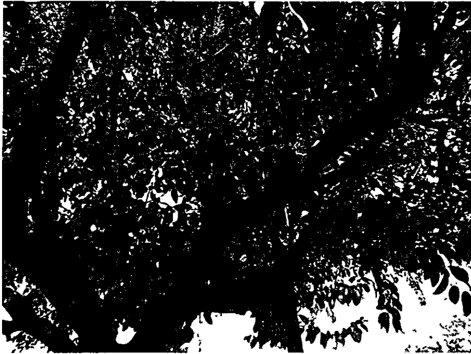
Fotografia 6 Brotação de ramos epicórmicos e galhos secos

Concluo portanto que há justificativa técnica para supressão do exemplar arbóreo em questão uma vez que apresenta risco de elevada importância.