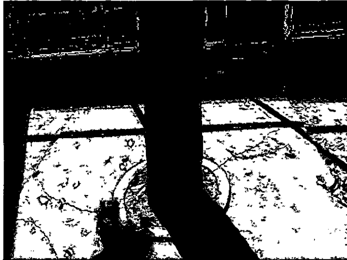
Fotografia 3 Tronco cercado por área impermeável