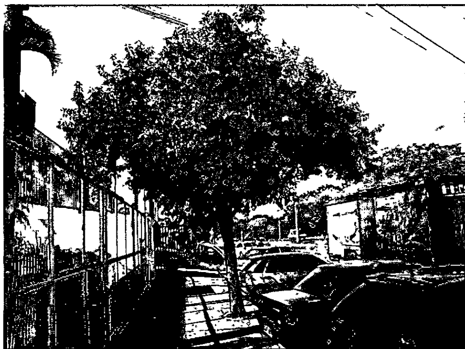
Fotografia 2 exemplar de Ligustrum lucidum próximo à rede elétrica