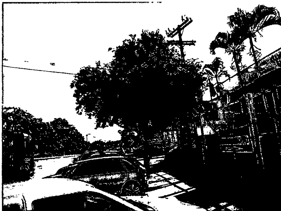
Fotografia 1 exemplar de Ligustrum lucidum próximo à rede elétrica

Seguem fotografias para caracterizar o exemplar arbóreo e seu entorno.