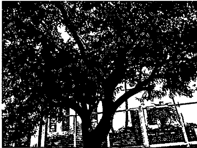
Fotografia 4 evidência de maus tratos ao exemplar