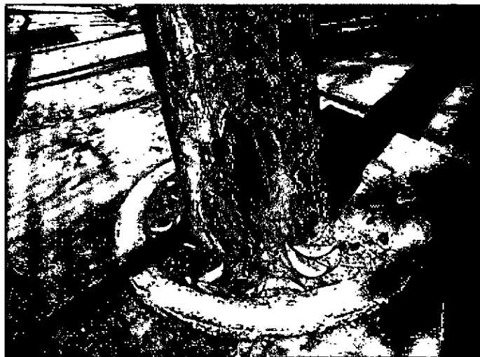
Fotografia 5 Cavidade na base do tronco e Ausência de Neilóide