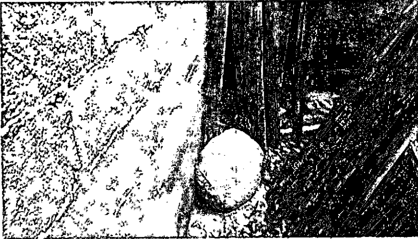
Rocha que rolou para o quintal dos moradores