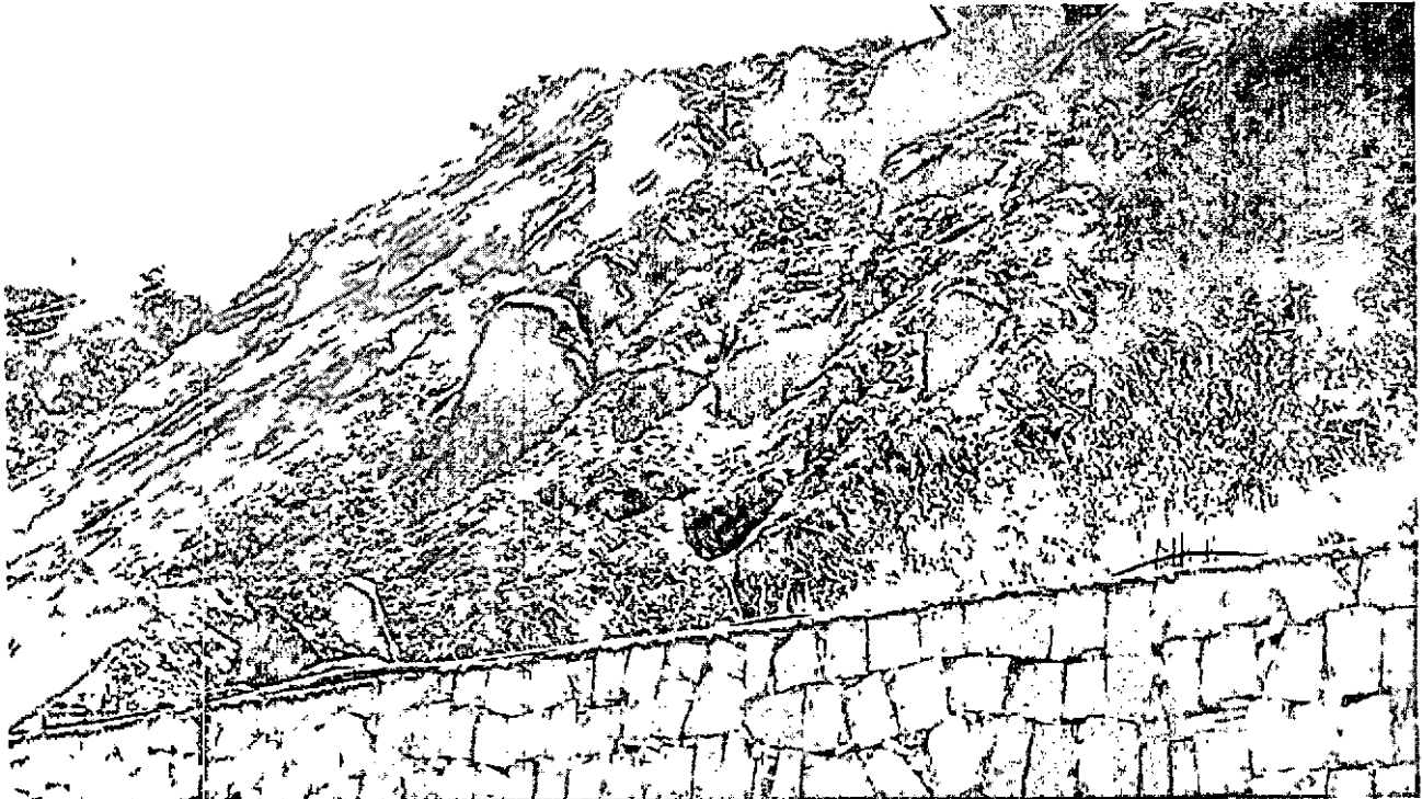
Vista do quintal de um dos vizinhos