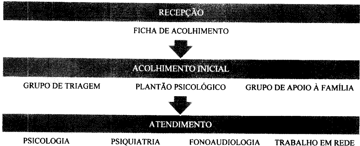
Figura 1. Modelo de Atenção da Casa do Adolescente

Este modelo de atenção tem sido construído a partir da reflexão sobre os dados dos atendimentos realizados na Casa do Adolescente, tendo como pano de fundo as legislações e políticas públicas nacionais vigentes relacionadas ao cuidado em Saúde Mental. A equipe da Casa do Adolescente está atualmente constituída por três psicólogas, uma assistente social, um pedagogo, um psiquiatra e uma fonoaudióloga.