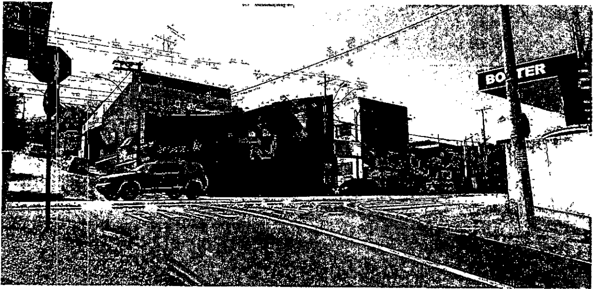
Av. Joaquim Alves Correia x Av. Independência – sentido Jardim do Lago