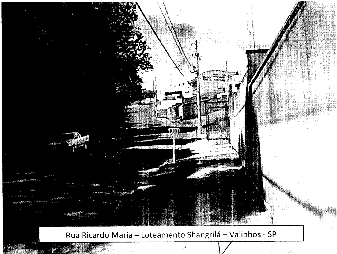
Rua Ricardo Maria – Loteamento Shangrilá – Valinhos - SP