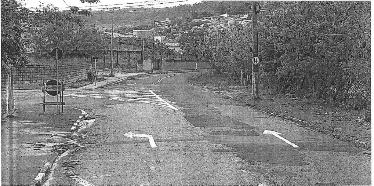
Visão a partir da Rua Ezequiel Benedito da Silva, sentido Estrada do Jequitibá