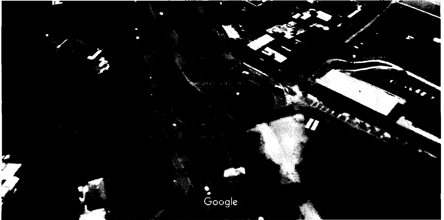
Imagens ©2018 DigitalGlobe, Dados do mapa ©2018 Google 10 m