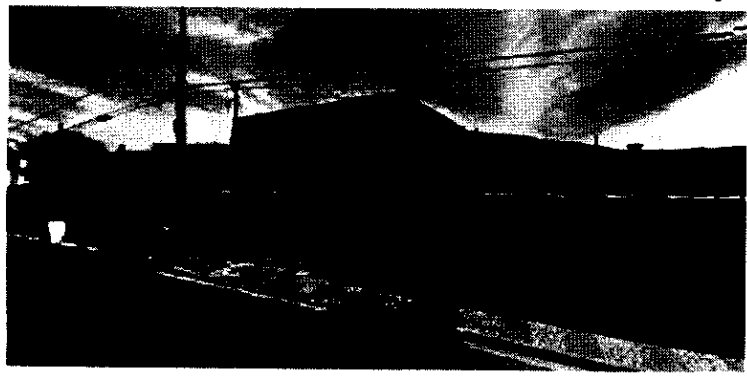
Jardim Jurema Valinhos - SP 13274-465