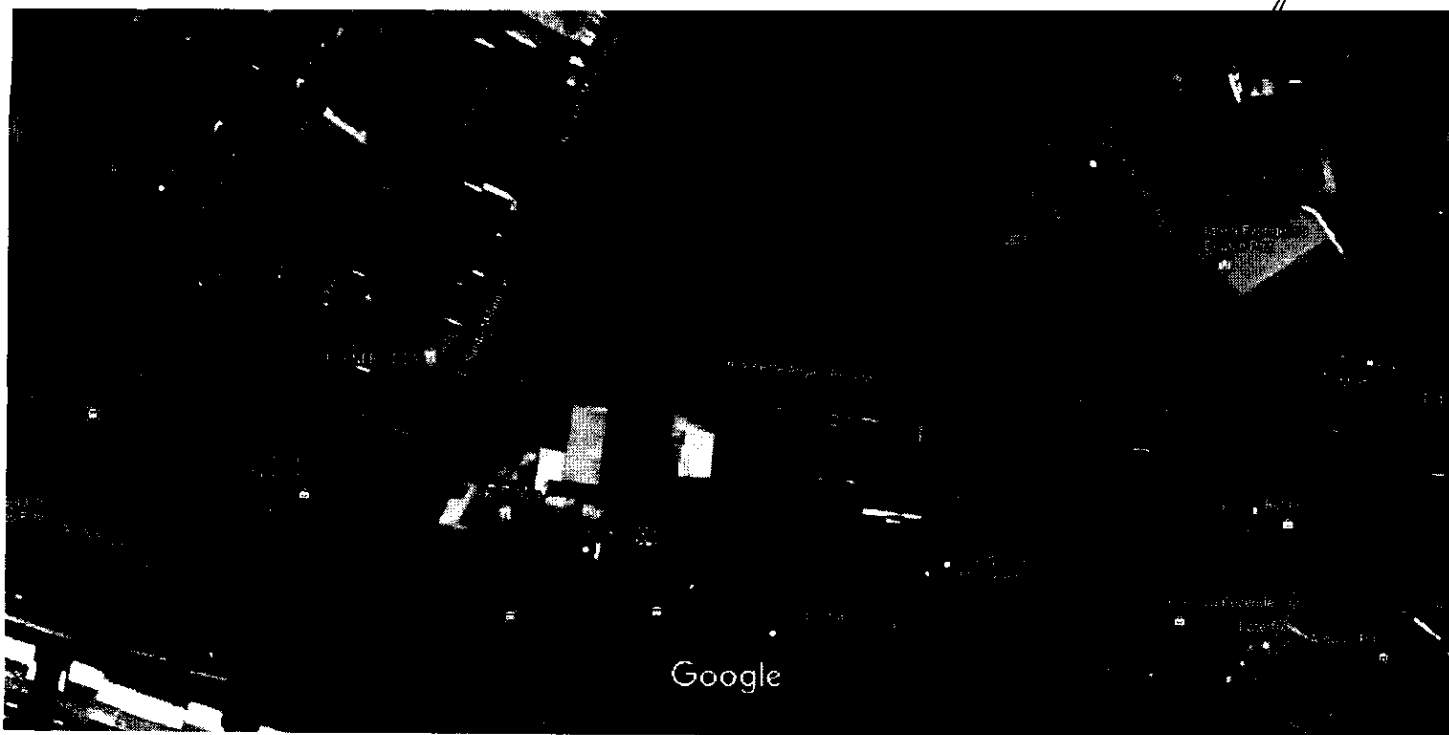
Imagens ©2018 DigitalGlobe, Dados do mapa ©2018 Google 20 m