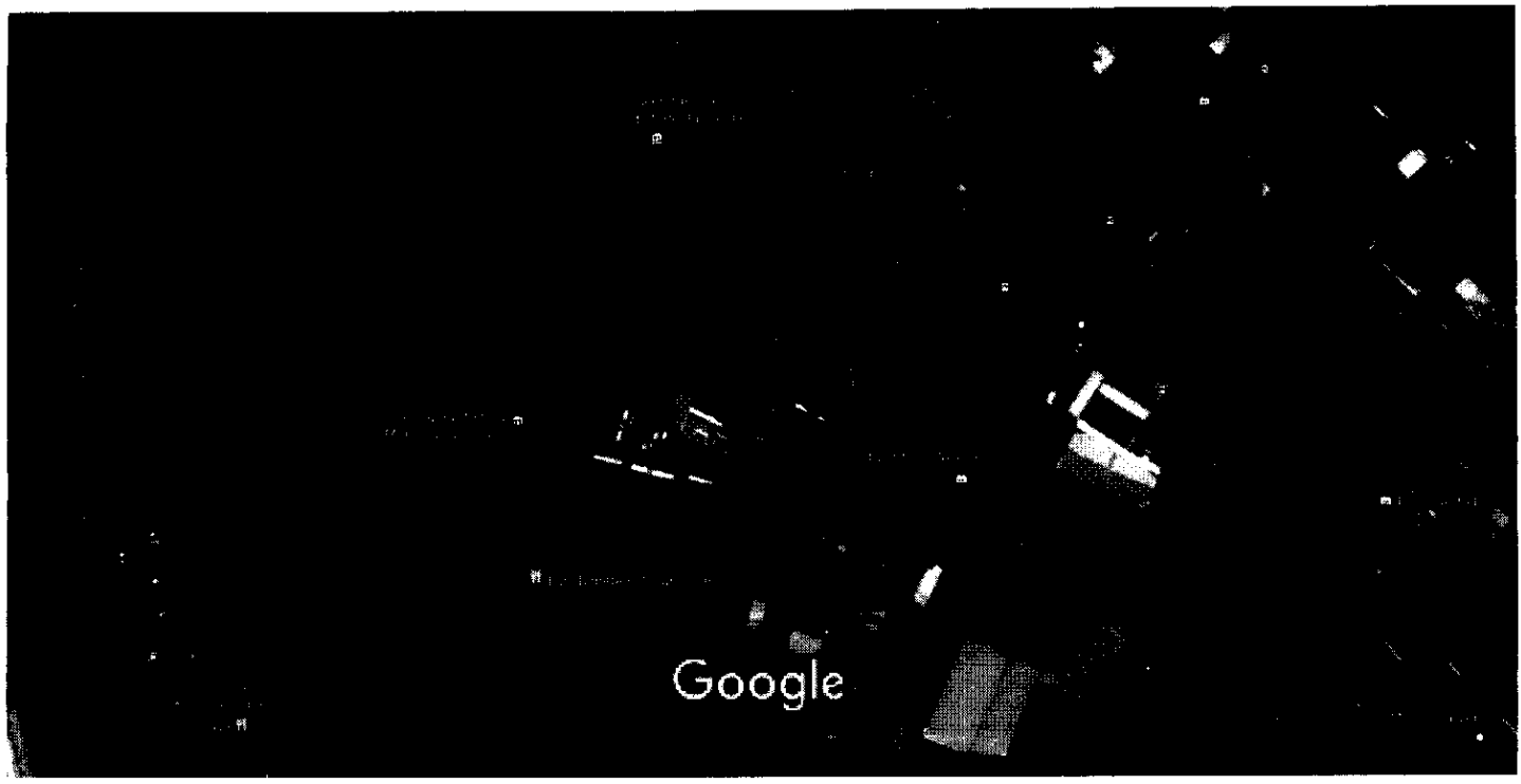
Imagens ©2018 DigitalGlobe, Dados do mapa ©2018 Google 20 m